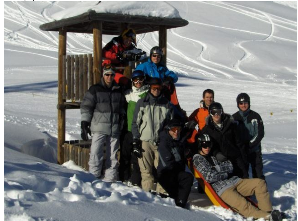
Skiweekend im Januar 2009 in Davos (Skigebiet Parsenn)